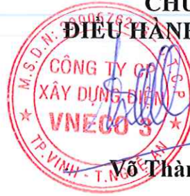
Võ Thành Lương